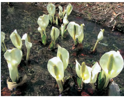
ミスバショウの群生