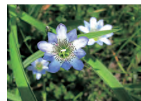
タテヤマリンドウ