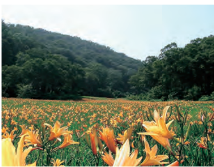
ニッコウキスゲの群生