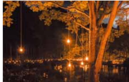
秋山郷の天池周辺に約2000個のキャンドルが灯され幻想的な風景が浮かびあがります。不思議で落ち着きのある世界を堪能ください。デートにもいいですよ。