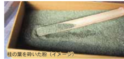
桂の葉を砕いた粉(イメージ)

飯山駅(9:00 発)=桂の巨木(片道15分の山道を登ると現れます)=楽養館(イワナ御膳の昼食)=秋山郷総合センターとねんぼ(桂の葉っぱでお香づくり。秋山郷ではお盆が近くなると作っていました。売り物とは一味違う香りも楽しみ)=見倉橋(コバルトブルーの渓谷・自由散策)=道の駅信越さかえ(買い物)=飯山駅(17:30 着予定) ※雨天の場合、桂の木は他の場所で見学します。